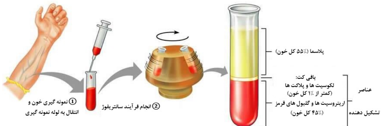
شکل ۲: تصاویری شماتیک از یک روش آماده‌سازی پلاسمای غنی از پلاکت.

اولین مرحله در آماده‌سازی PRP به صورت اتولوگ، نمونه‌گیری حدود ۱۵ تا ۶۰ سی‌سی از خون کامل فرد بیمار در روز تعیین‌شده برای درمان می‌باشد. اضافه کردن یک ماده‌ی ضدانعقاد خون هم‌چون دکستروز سیترات از انعقاد خون و ترشح شدن گرانول‌های پلاکتی جلوگیری می‌کند. با استفاده از یک روش سانتریفوژ دو مرحله‌ای یا روش double spin، نمونه خون کامل در یک سرعت پایدار (ثابت)، جهت تشکیل سه لایه‌ی مختلف، تحت عمل سانتریفوژ قرار می‌گیرد. لایه‌ی پایینی شامل سلول‌های قرمز خون می‌باشد، لایه‌ی میانی که لایه مرکزی (buffy coat) می‌باشد، شامل سلول‌های سفید خون می‌باشد و لایه‌ی بالایی حاوی پلاکت‌های محلول‌شده در پلاسما